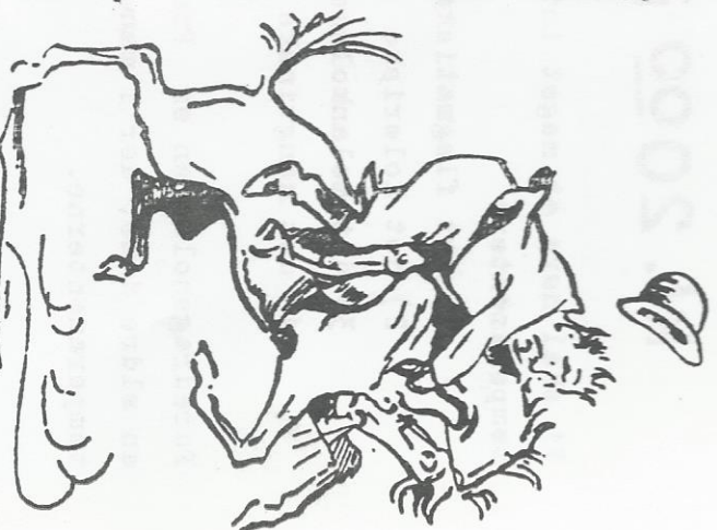
Hold ud trods vanskeligheder.