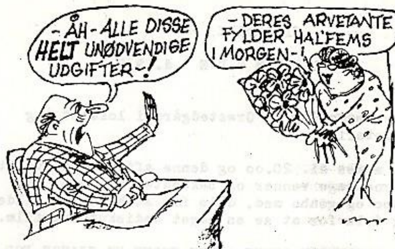
Budgetterne bør lægges med størst mulig hensyn til udbyttet.

Hver familie skulle jo møde med ca. 5 minutters