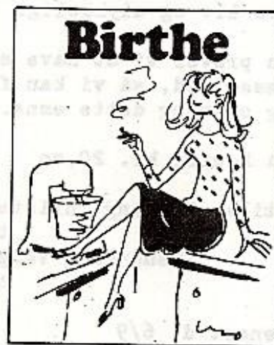
Efterhånden koster det så meget at have det godt, at man for at få råd til det har det ad h... til

På gensyn til en ny gilde sæson ved du at det er den 5 sæson