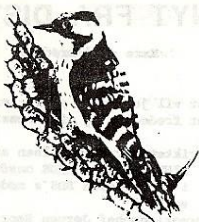
108. Lille flagspætte, han, Dendrocopos minor

For ikke så få dage siden hørte vi den første musvit fløjte ude i haven. Som sagt der er mange forårs tegn hvis du opmærksomt følger med i naturen omkring dig.