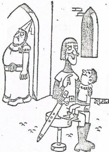
- Og så slog jeg Sankt Georg ihjel og giftede mig med dragen...