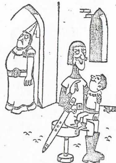
- Og så slog jeg Sankt Georg ihjel og giftede mig med dragen...