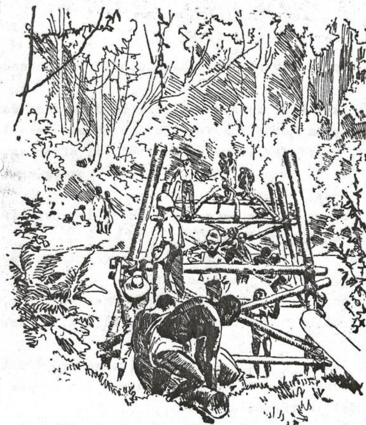
B-Ps opgaver i Ashanti i 1895-96 omfattede bygning af mange primitive broer.

tænk, - det er 90 år siden, at dette primitive brobyggeri foregik, siden er der sket meget rundt om i verden. Det der var en pioneropgave dengang, til gavn for en nyopdaget verden, er en leg for de små og store børn, som er spejdere netop i disse år. I fællesskab kan meget nås, og meget skabes, men der hvor BP, i sin tid byggede bro, og skabte ny udvikling, er det netop nu brydningstider, og det skaber jo eftertanke.