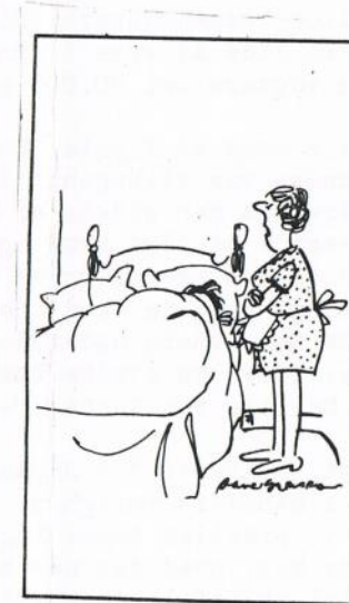
— Solen er stået op, schweizerfrancen er gået op, leveomkostningerne er gået op, lønningerne er gået op, alt rører på sig... undtagen lige dig!