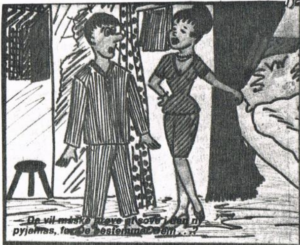
— De vil måske gerne prøve i den nye pyjamas, færdige bestillingen...