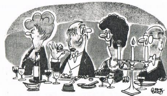
— Jeg skal ikke kunne sige det med sikkerhed, men jeg tror, det er lavet af vegetabilsk protein, glukose, animalsk fedt, kulhydrater, mættede fedtsyrer og aromatiske tilsætningsstoffer...