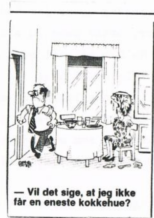
— Vil det sige, at jeg ikke får en eneste kokkehue?