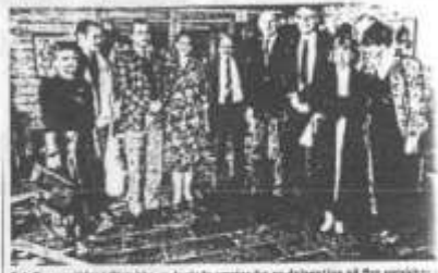
Sct. Georgsgildet i Østtykke og de lokale værter for en delegation fra byen Czersk.