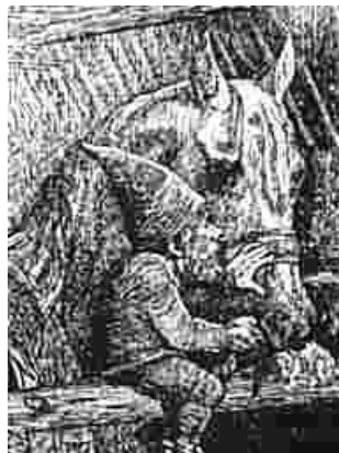
Bondens nisse var en lille væsen, der navnlig hjalp til i stalden

Første gang (så vidt vides) at vi hører om nisser lavet specielt til jul, og nisser der giver gaver, er ved danske kunstners julefest i Rom, vinteren 1836. Festen blev holdt i maleren Constantin Hansens lejlighed. Blandt gæsterne var Vilhelm Marstrand, Bertel Thorvaldsen og Bindesbøll. Værten Constantin Hansen havde lavet en udsmykning med papirklip som forestillede nisser i forskellige situationer. Nisser, der dansede om julegrøden, sloges med katten og nisser, der drog over Ponte Molle med julegaver for at holde jul i Rom.