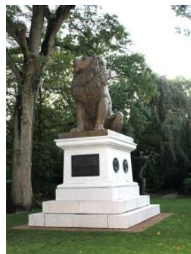
Istedløven i Flensborg Den 8 september 2011