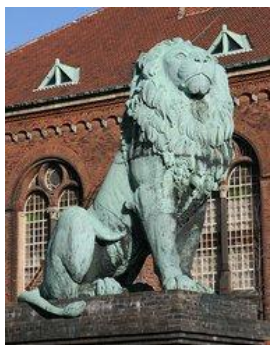
Istedløven i København 2007

'Slaget på Isted Hede fandt sted den 25 juli 1850.