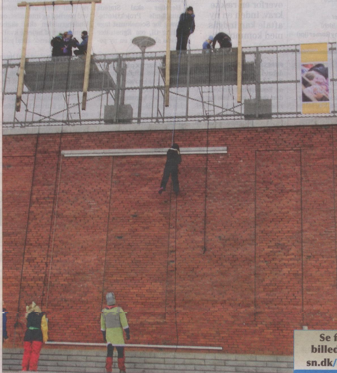
Spejderne fik mulighed for at rapelle ned fra taget af Føtex, hvilket blev en stor oplevelse for mange.

- Det var koldt, men heldigvis var der ingen vind.