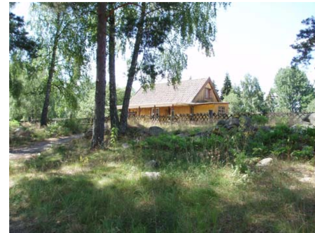
ved siden af dette hus skal vi have telt til udlevering af maden