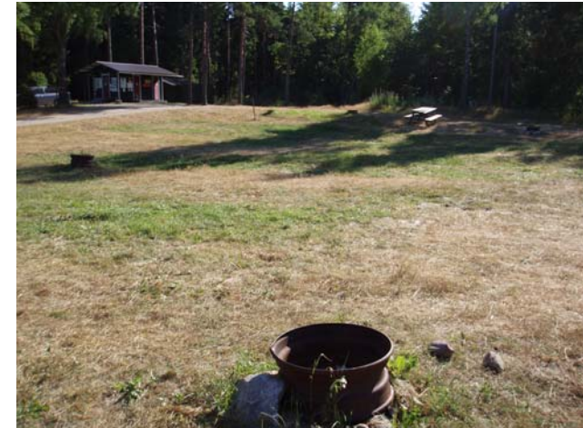
denne plads med toiletbygning i baggrunden er reserveret til vores campingvogne og telte