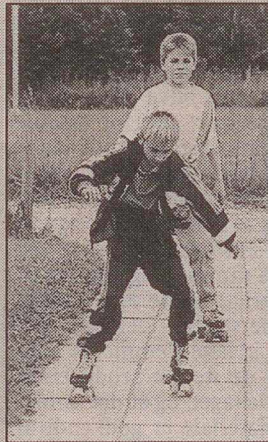
Børnene havde bl.a. mulighed for stå på rulleskøjter.

Ølstykke har for øjeblikket besøg af 15 børn fra Tjernobylområdet. Sammen med en leder er de på en tre ugers ferie i Danmark - et ophold, som byder på masser af spændende oplevelser. De er indkvarteret i spejderhytterne på Udlejrevej. SE SIDE 11