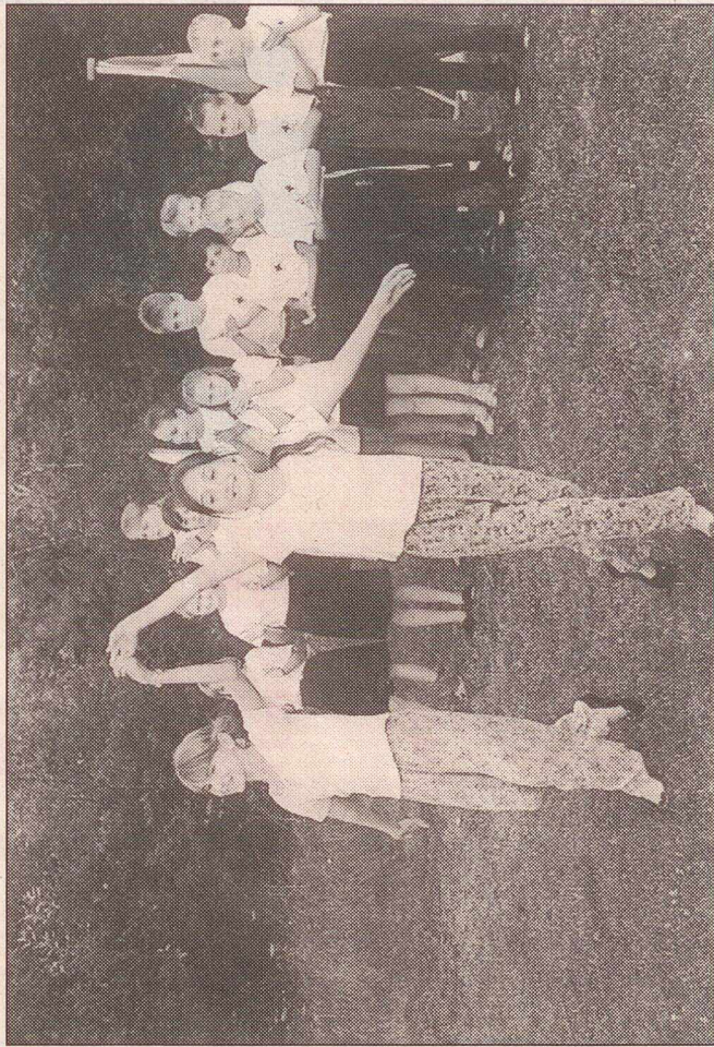
Der blev danset, sunget og klappet i fir stil, da de russiske børn underholdt gæsterne på afslutnings-aftenen

har det også været for de gildebrødre, der har brugt deres fritid på at klare alle de praktiske opgaver - uden dén frivillige indsats havde det slet