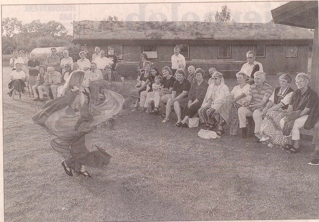
Den yngste af de 20 russiske børn kvitterede for sin ferie i et eventyrland med at danse en russisk folkedans.