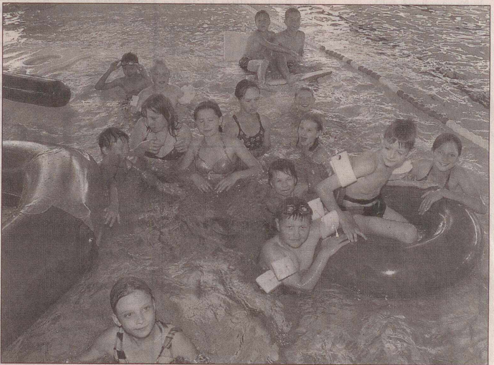
Sidste svømmetur i Ølstykke Svømmehal for de russiske ferie børn, inden turen går hjem i dag til Tjernobyl-området.

I dag kommer en bus for at hente børn og ledere og køre dem til Værløse, hvor et russiske militærfly venter på at flyve dem og børn fra andre sjællandske ferielejre for Tjernobyl-børn til en militærbase i Moskva. Herfra skal Ølstykkens gæster gennem de seneste uger køre videre med bus 450 kilometer sydpå til Bolkhor-disktrikket i Orjol-provinsen, hvor de bor. maj