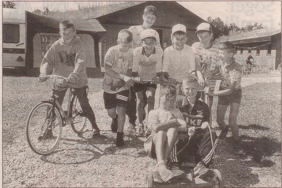
Cyklerne har været det helt store hit for børnene.

Kommunikationen foregår gennem tolke, da børnene ikke taler engelsk.