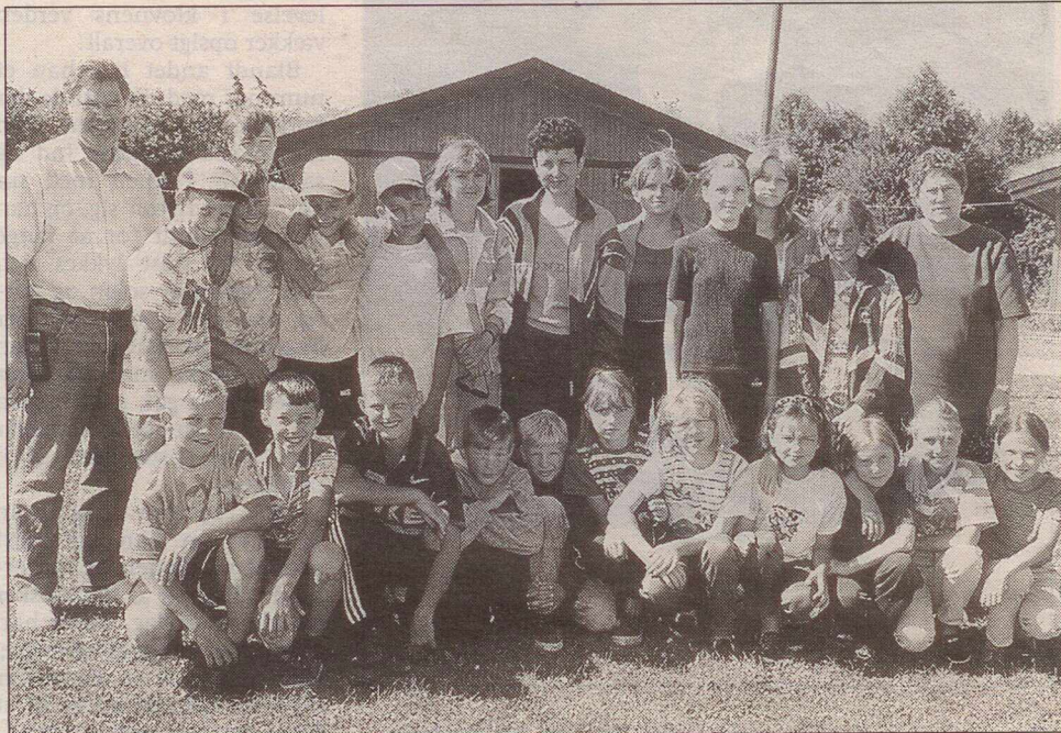
Tyve Tjernobylbørn har alletiders ferie i Ølstykke. Her er hele holdet samlet.