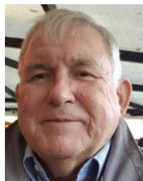
Gildekansler Povl-Erik Høxbroe